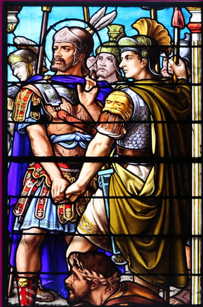
Détail du vitrail de la façade principale