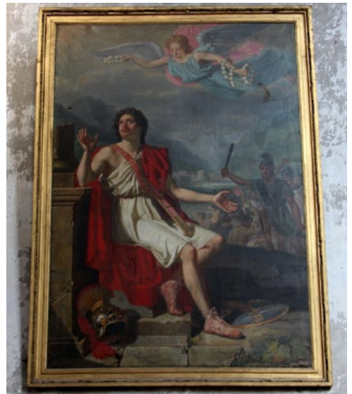
Un soldat romain lève un glaive et s'approche de Maurice, ce dernier regarde le ciel d'où descend un ange lui apportant la couronne des martyrs.

Par ailleurs, des reliquaires sont situés de part et d'autre du maître-autel, l'un renferme le chef de saint Maurice. Cette relique était initialement conservée à l'abbaye de Saint-Pierre-les-Dames.