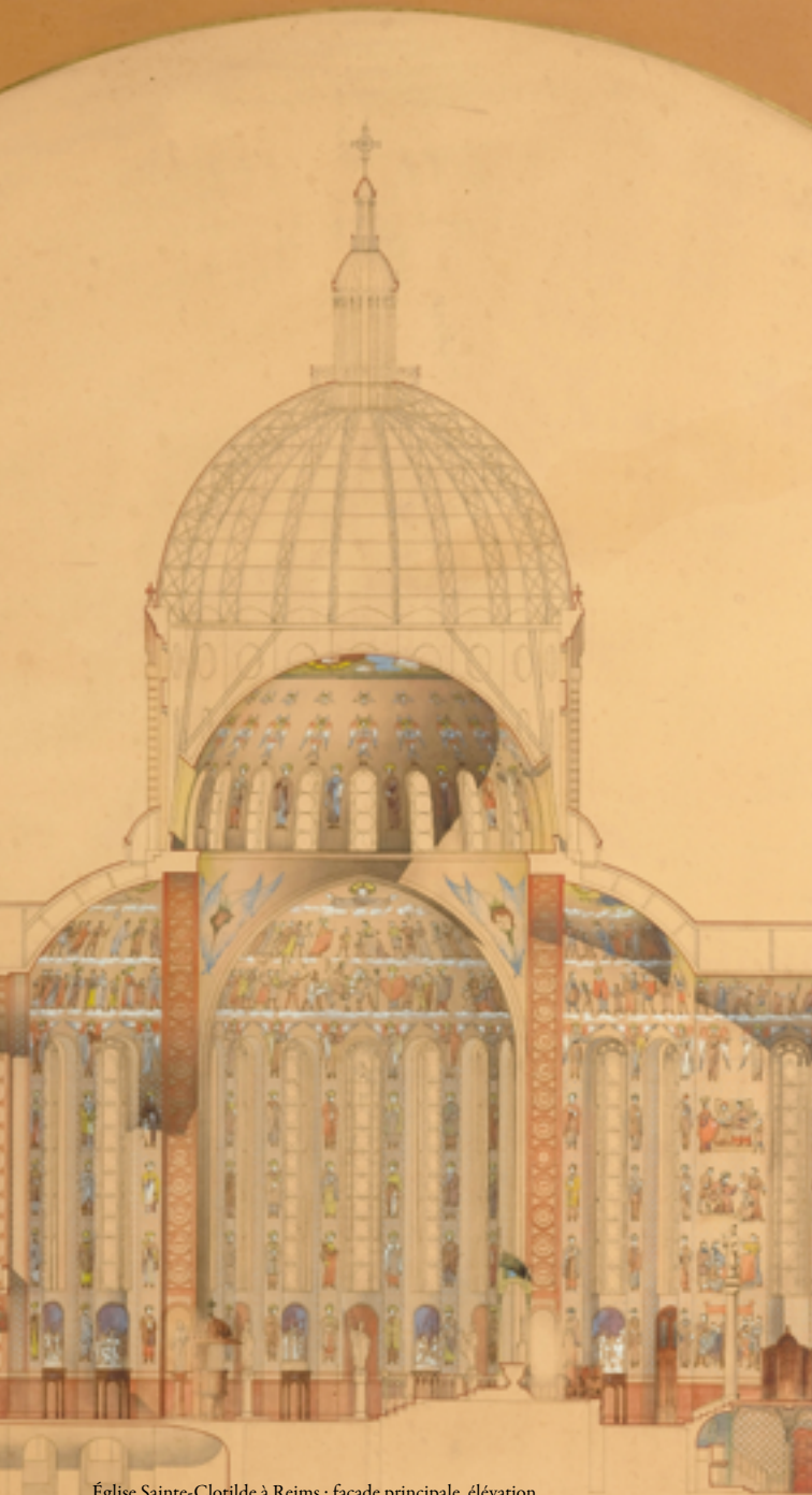
Église Sainte-Clotilde à Reims : façade principale, élévation, coupe par Alphonse Gosset