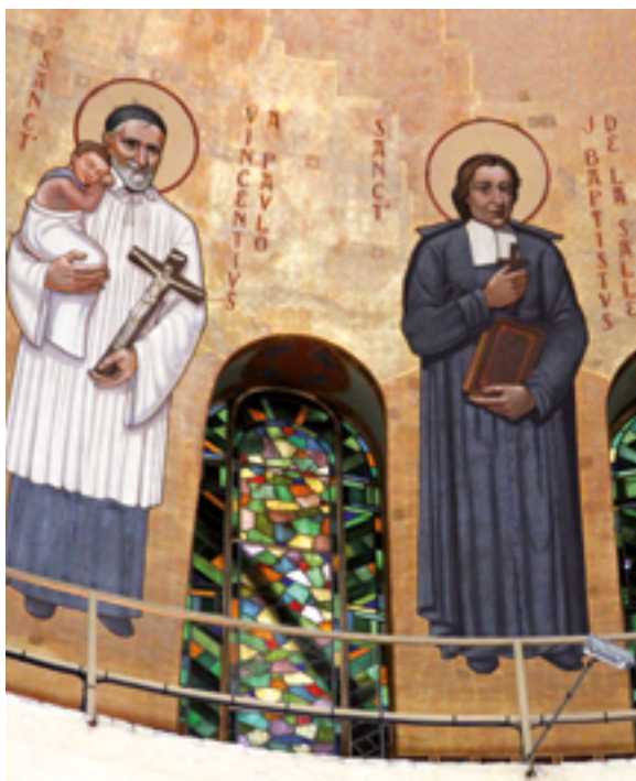
Détails des saints Vincent de Paul et Jean-Baptiste de la Salle

L'élément décoratif principal de la basilique se situe sous la coupole. Conformément au style byzantin, l'architecture doit amener l'œil du visiteur au sommet où est représenté un Christ Pantocrator sur fond doré. De face, il fait le geste de la bénédiction et tient un globe. La composition est tripartite : le Christ au centre, entouré d'anges, puis un autre cercle avec des saints et des figures de l'histoire religieuse locale ou nationale. On peut identifier entre autres : Charlemagne, le pape Urbain II, le roi Saint-Louis, Saint-Jean-Baptiste de la Salle, Saint-Bernard de Clairvaux, Saint-Nicaise, Saint-Remi... En raison d'un manque de fonds, la décoration est restée inachevée en certains points. Pour la coupole, des toiles marouflées ont été posées à la place des peintures initiales.