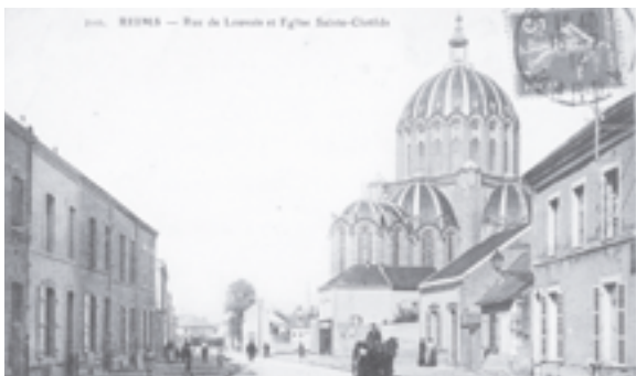
La basilique Sainte-Clotilde vue de la rue de Louvois

En 1896, le cardinal Langénieux, archevêque de Reims, souhaite commémorer le 14 e centenaire du baptême de Clovis, premier roi de France chrétien. La tâche n'est pas simple car il règne alors un climat anticlérical dans la ville. Les radicaux viennent de fêter le centenaire de la Révolution, les chrétiens veulent s'imposer en célébrant le baptême de Clovis. Le cardinal décide la construction d'une grande église en hommage à Clotilde, femme de Clovis, qui a conduit le roi au baptême. Il souhaite également que le monument soit un reliquaire de la France chrétienne. Les habitants s'opposent d'abord à ce projet mais l'acceptent plus tard lorsque la congrégation des filles du Sacré-Cœur de Marie s'y installe. Elles apportent soins aux malades, enseignement et aide aux démunis du quartier.