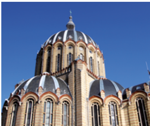
Dômes de la basilique

La tradition se poursuit jusqu'à aujourd'hui où l'on compte quatre cent deux reliquaires renfermant près de trois mille reliques de saints. Parmi celles-ci se distinguent plusieurs types de reliquaires : ceux imitant l'architecture d'une église ou la forme de la croix, ceux évoquant directement le saint et ceux symbolisant l'Ascension du saint sous la forme d'un ange.